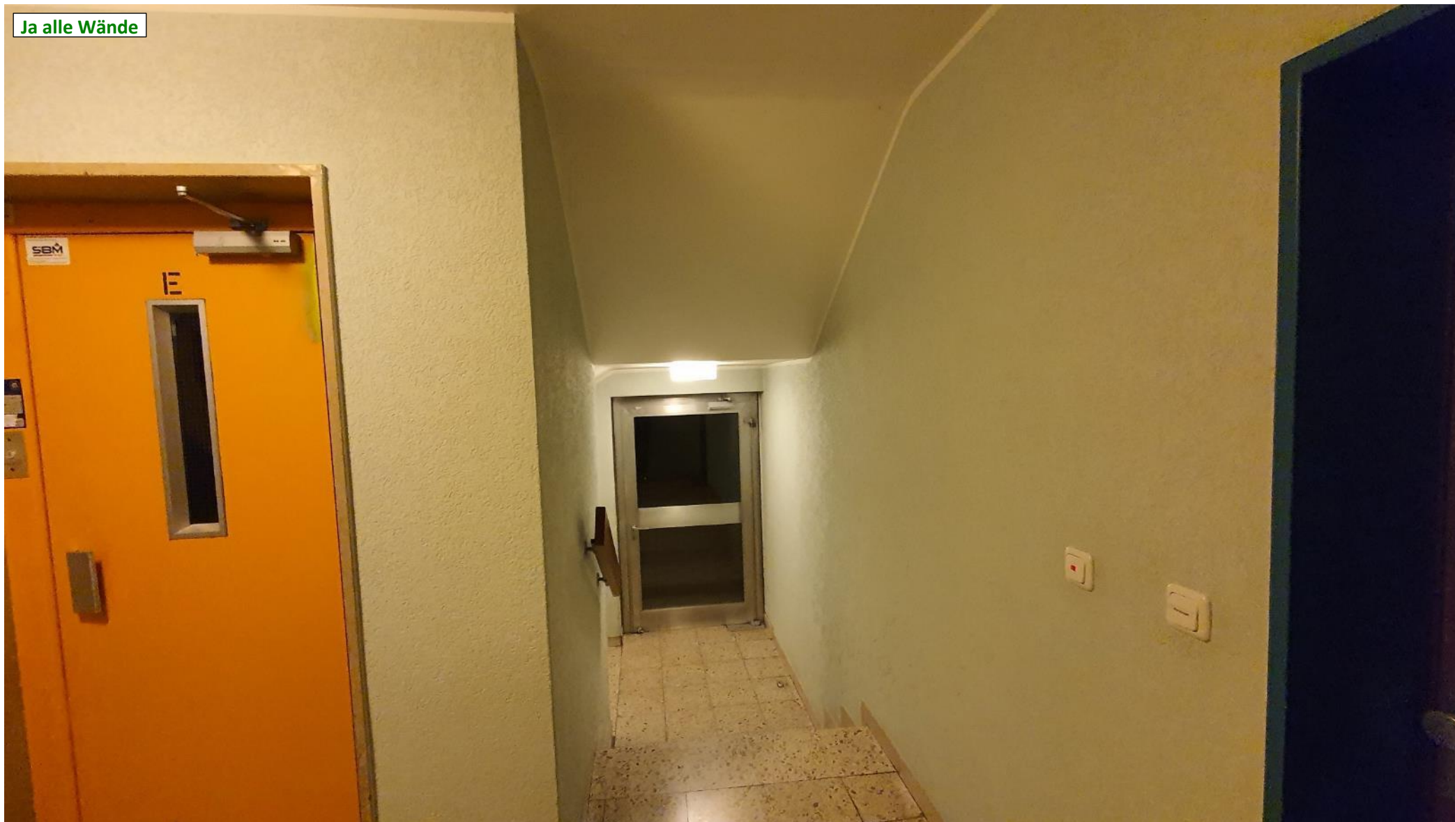
Ja alle Wände